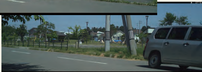
HL2XCにて撮影：時速60キロ